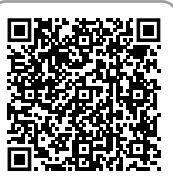
Товары для ванны